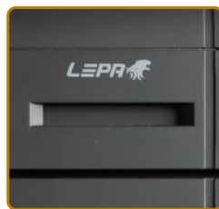
2.5" SSD/HDD 熱插拔插槽