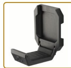
磁吸式可移動耳機掛架