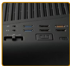
完整IO支援快充及 風扇轉速控制