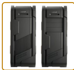
EZ Slide滑動前板 可蓋住5.25"光碟機